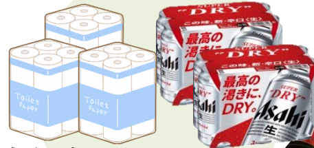
トイレットペーパー 又は 缶ビール 12本