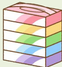
ボックスティッシュ