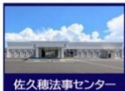
佐久穂法事センター