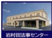
岩村田法事センター