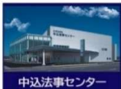
中込法事センター