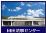
臼田法事センター