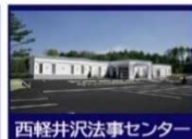
西軽井沢法事センター