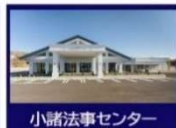
小諸法事センター